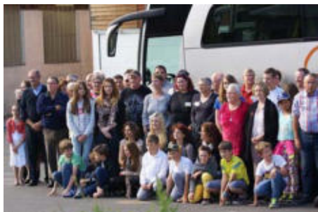
Ankunft in Lucenay-lès-Aix

Nach fast 700 Km Fahrt wurden wir am Donnerstag (Himmelfahrt) herzlich in Lucenay empfangen.