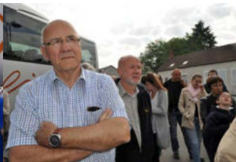
Donnerstag: Ankunft in Lucenay-lès-Aix