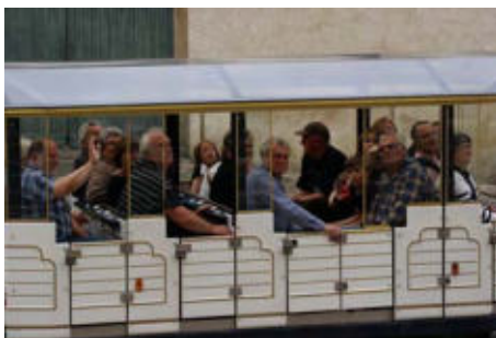
Gemeinsam im „Petit Train“ durch Bourges