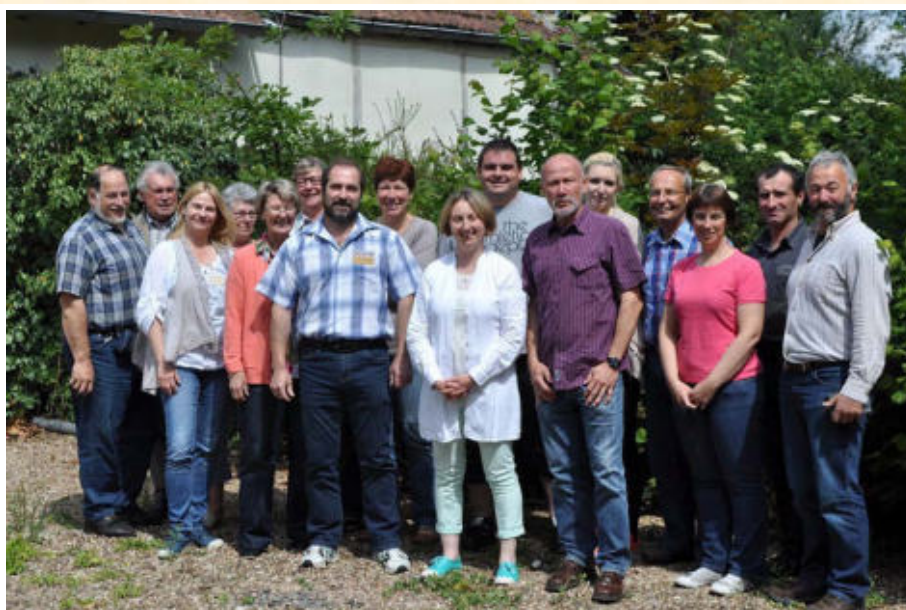
Das Foto zeigt die beiden Vorstände aus Lucenay und Waldesch zum Ende einer gemeinsamen Sitzung (Lucenay, im Mai 2014)

Das Titelbild wurde aufgenommen am Samstag, im Rahmen des Partnerschaftsbesuches 2014 in Lucenay