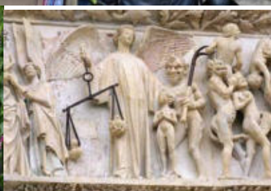
Freitag: Ausflug nach Bourges und Besuch der Altstadt und der Kathedrale